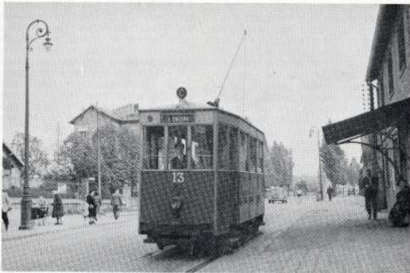
Toujours sur la ligne C, mais avec du matériel remis en état, le terminus de Porchefontaine et le passage devant la nouvelle gare des Chantiers, à comparer avec la photo de la page 60

Deux vues du terminus du tramway, effectivement le bâtiment possède une avancée mais qui est bien plus basse et dont les armatures métalliques sont de style différent. Ci-dessous photos.