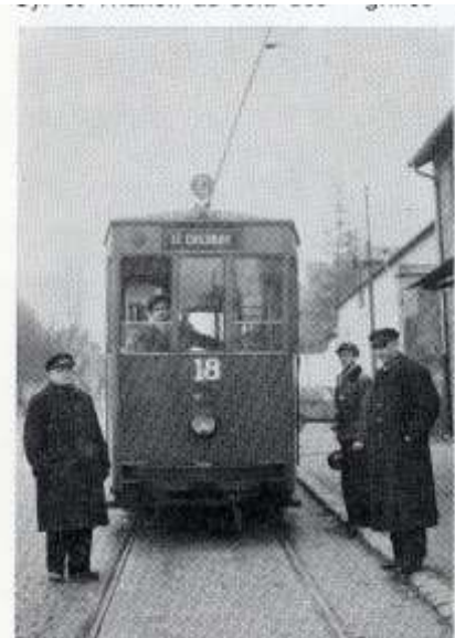
Le « brain trust » de l'exploitation au terminus de Porchefontaine